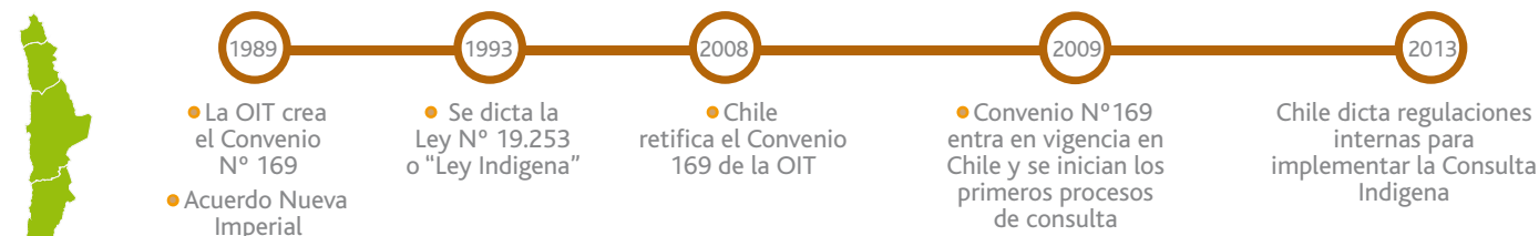
Fig. 1: Consulta indígena en Chile: desde el "Acuerdo de Nueva Imperial" a la implementación del Convenio N° 169 de la OIT.

La aplicación de este Convenio, está especificado en normativas internas que buscan dar cumplimiento a sus disposiciones. En esta sección, se revisan algunas de estas leyes y normas vigentes que enmarcan la actual relación entre el Estado y los pueblos indígenas.